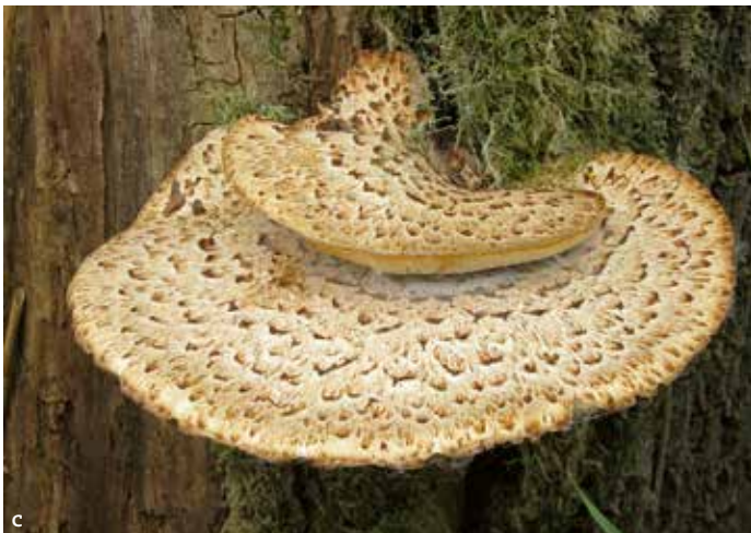
2. Drie van de meest keversoortenrijke boomzwammen: (a) Fomes fomentarius , (b) Laetiporus sulphureus en (c) Polyporus squamosus .