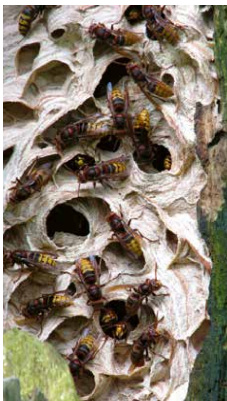
5. Hoornaarnest in holle wilg. 5. Nest of an European hornet in hollow willow.