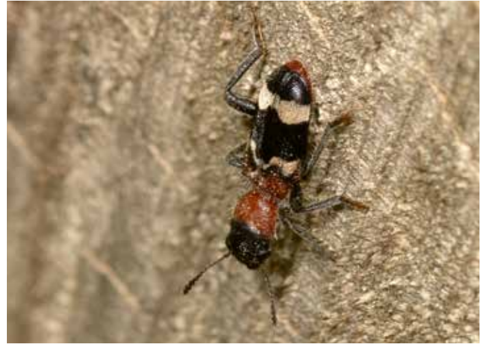
11. Thanasimus formicarius , een soort mierkever (Cleridae) waarvan de larven in de subcorticale gangenstelsels van schorskevers (Scolytinae) leven. Daar voeden ze zich met de eitjes, larven en poppen van schorskevers. De volwassen kevers eten ook volwassen bastkevers.

10. Platystomos albinus , a species of fungus weevil (Anthribidae) whose larvae live on decaying deciduous wood affected by fungi.