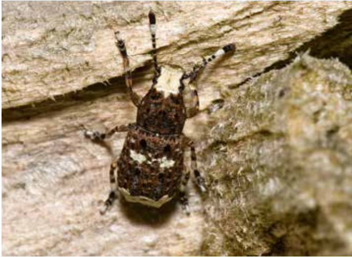
10. Platystomos albinus , een soort boksnuitkever (Anthribidae) waarvan de larven leven van door schimmels aangetast loofhout.

10. Platystomos albinus , a species of fungus weevil (Anthribidae) whose larvae live on decaying deciduous wood affected by fungi.