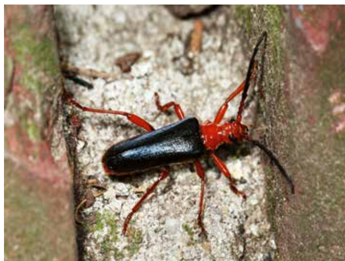
9. Rhamnusium bicolor , een boktor (Cerambycidae) waarvan de larven leven op het grensvlak van levend en dood hout in vochtige scheuren en holtes waar ze zich voeden met dood hout.

8. Saperda scalaris , a longhorn beetle (Cerambycidae) whose larvae feed on dead deciduous wood.