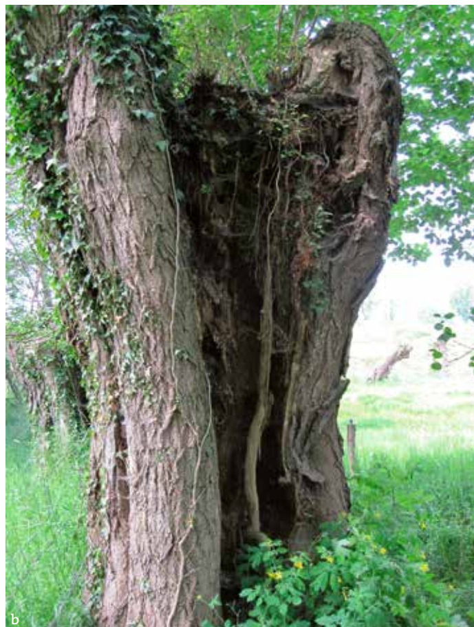
4. Boomholtes: (a) geknotte es met holle knot; (b) geheel holle knotwilg. 4. Tree hollows: (a) pollarded ash with hollow formed after pollarding; (b) totally hollow pollard willow tree.