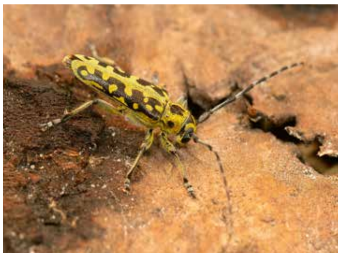
8. Saperda scalaris , een boktor (Cerambycidae) waarvan de larven zich voeden met dood loofhout.

houtkevers), Eucnemidae (schijnkniptorren), Lissominae uit de familie Elateridae (kniptorren), Lycidae (netschildkevers), Malthininae uit de familie Cantharidae (weekschildkevers), Nosodendridae (boomsapkevers), Trinodinae uit de familie Dermestidae (spekkevers), Bostrichidae (boorkevers), Lymexyliidae (werfkevers), Phloiophilidae (winterwekschilden), Tillinae uit de familie Cleridae (mierkevers), Rhadalinae uit de familie Melyridae (bloemwekschilden), Sphindidae (slijmzwamkevers), Rhizophaginae uit de familie Monotomidae (kerkhofkevers), Cucujidae (platte schorskevers), Erotylidae (prachtzwamkevers), Biphyllidae (houtschoolzwamkevers) Cerylonidae (dwerg-houtkevers), Endomychinae en Anamorphinae uit de familie