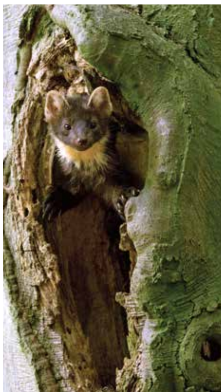
6. Nest van een boommarter. 6. Nest of an European pine marten.