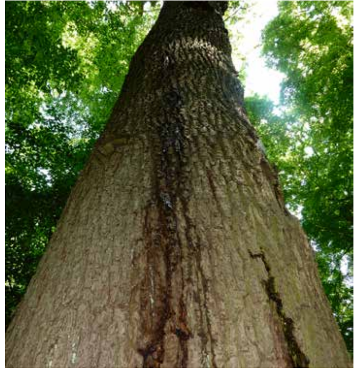
3. Sappende eik.

Onder xylobionte soorten verstaan we soorten die afhan-