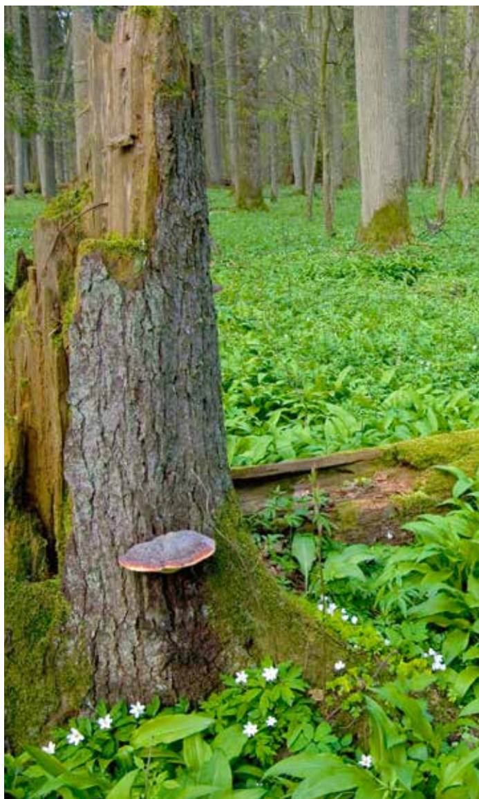
15. Białowieża Nationaal Park, één van de laatste Europese oerbossen.

Dat er zo weinig bijzondere, gespecialiseerde soorten voorkomen in Nederland wordt waarschijnlijk hoofdzakelijk veroorzaakt doordat er in Nederland geen oerbos (figuur 15) meer is. De fauna lijkt zich door verbeterd bosbeheer, waarbij minder dood hout uit de natuur verwijderd wordt, de laatste decennia echter wel te herstellen en zelfs rijker te worden. Sinds de wijzigingen in het beheer vanaf de jaren 1980 is een indrukwekkend aantal obligaat aan dood hout gebonden kevers gevonden die nieuw bleken voor de Nederlandse fauna (tabel 7). Vorst (1994)