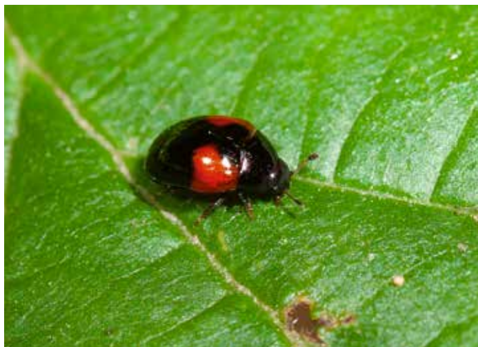
14. Tritoma bipustulata , een soort prachtzwamkever (Erotylidae) waarvan de larven leven in en van diverse soorten boomzwam.

14. Tritoma bipustulata , a species of pleasing fungus beetle (Erotylidae) whose larvae live in and of various types of tree fungus.