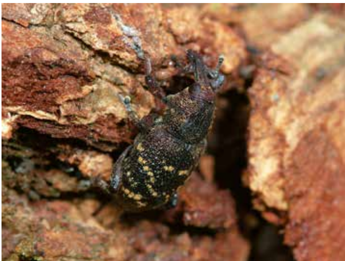
12. Hylobius abietis , een soort snuitkever (Curculionidae) waarvan de larven leven in de wortels en stobben van dode of stervende naaldbomen. Ze voeden zich met dood hout. De adulte kevers eten de bast van jonge takken.

11. Thanasimus formicarius , a species of checkered beetle (Cleridae) whose larvae live in the subcorticolle galleries of bark beetles (Scolytinae). There they feed on eggs, larvae and pupae of bark beetles. The adult beetles also consume adult bark beetles.