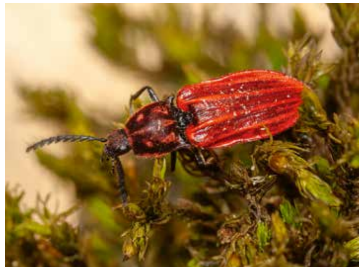
13. Anostirus purpureus , een soort kniptor (Elateridae) waarvan de larven in de vermolmde wortels van loofbomen leven. Wat ze eten is nog niet duidelijk: molm of levende prooi, of een combinatie. De adulte kevers bezoeken bloemen.

12. Hylobius abietis , a species of weevil (Curculionidae) whose larvae live in the roots and stumps of dead or dying conifers. They feed on dead wood. The adult beetles eat the bark of young branches.