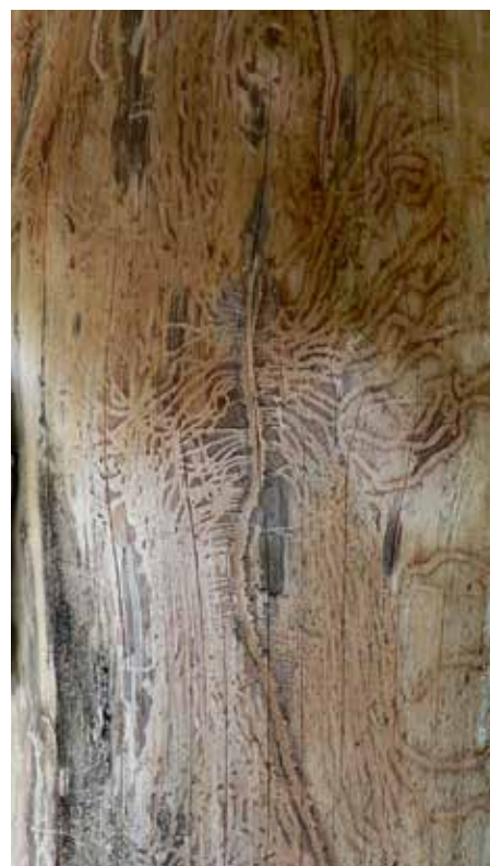
7. Adulten en larven van de dennenscheerder Tomicus piniperda maken gangenstelsels in de bast van verzwakte of recent dode den- nen. 7. Imago and larvae of the common pine shoot beetle Tomicus piniperda tunnel galleries through the bark of weakened or recently died pine trees.